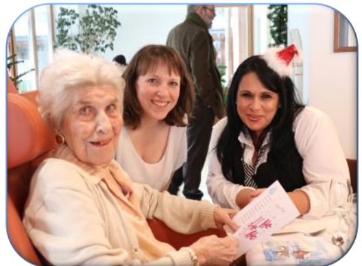
Noël des aînés