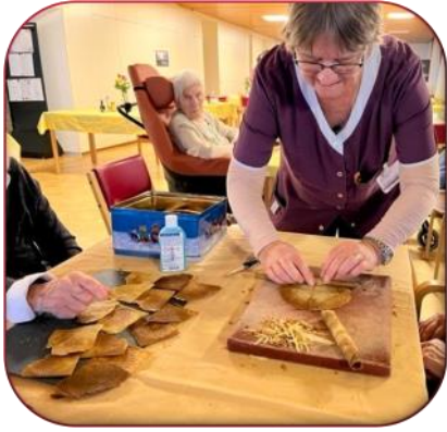
Confection de biscuits de Noël et bricelets, beaucoup de travail mais que c'était bon !