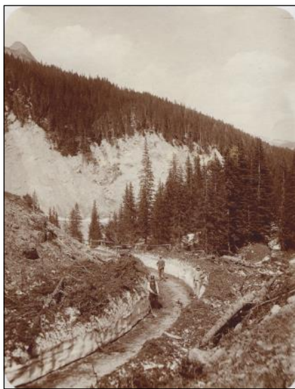
Juillet 1910 Col du Pillon

Le début des chroniques écrites des Ormonts font suite à l'avalanche poudreuse du 7 février 1749 qui s'est détachée du flanc sud de la chaîne Chaussy-Para vers 5hres du matin. Il y eut de nombreuses pertes humaines, de bétail et de bâtiments.