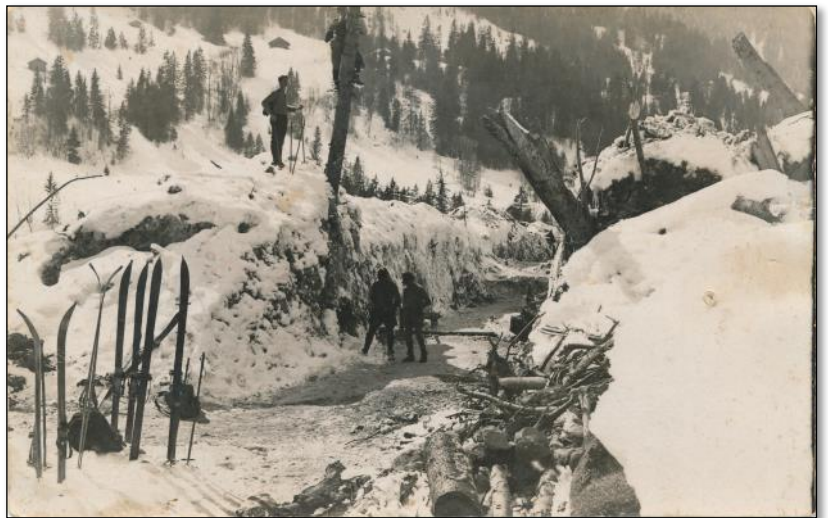
La Murée

Et maintenant, nous vous laissons tester vos connaissances en patois... A vous de jouer !