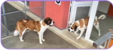
Sortie au musée Barryland à Martigny