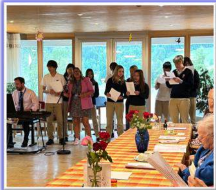
Concert de l'Aiglon Collège