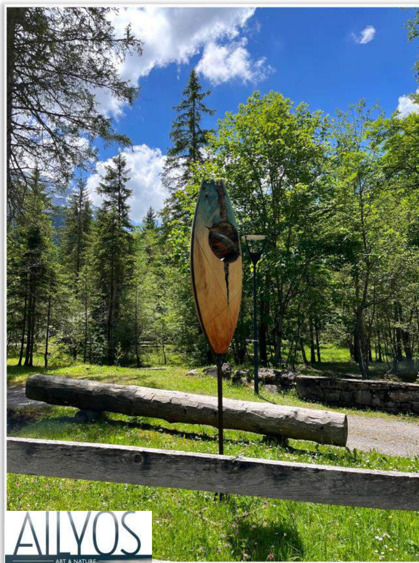
« Lune Mystique » d'Alexandre Berlioz