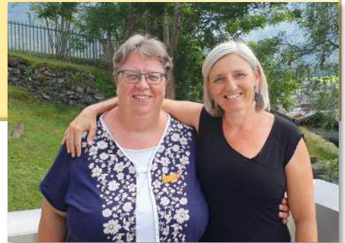
Les joies de la balade