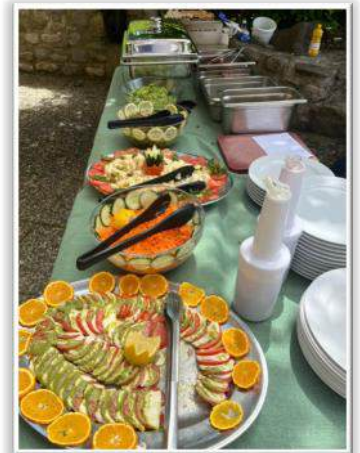
Profiter de la terrasse