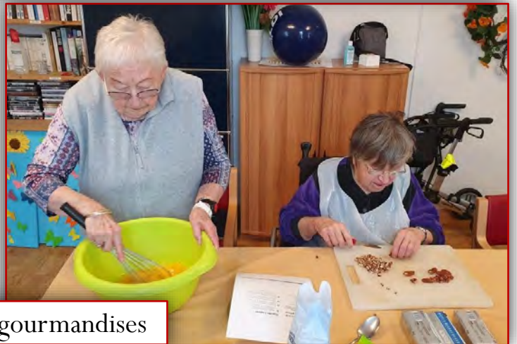
Confection de gourmandises