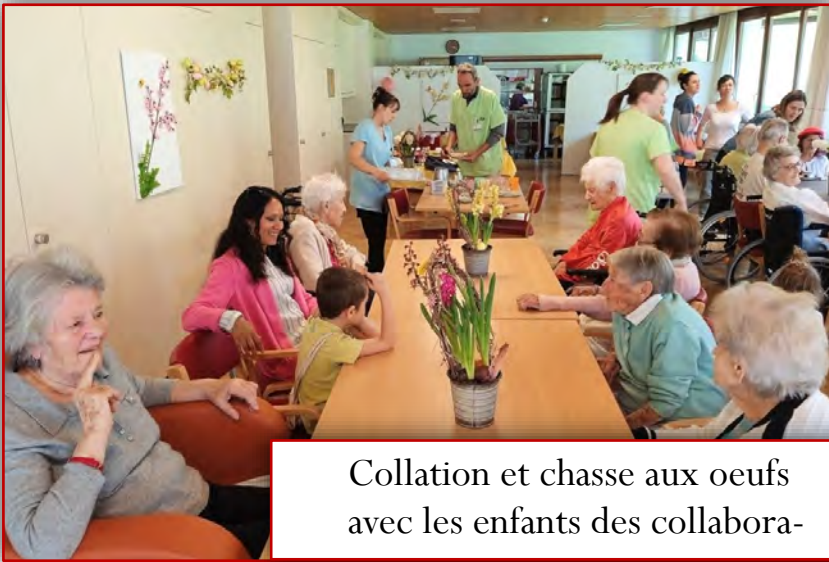
Collation et chasse aux oeufs avec les enfants des collabora-