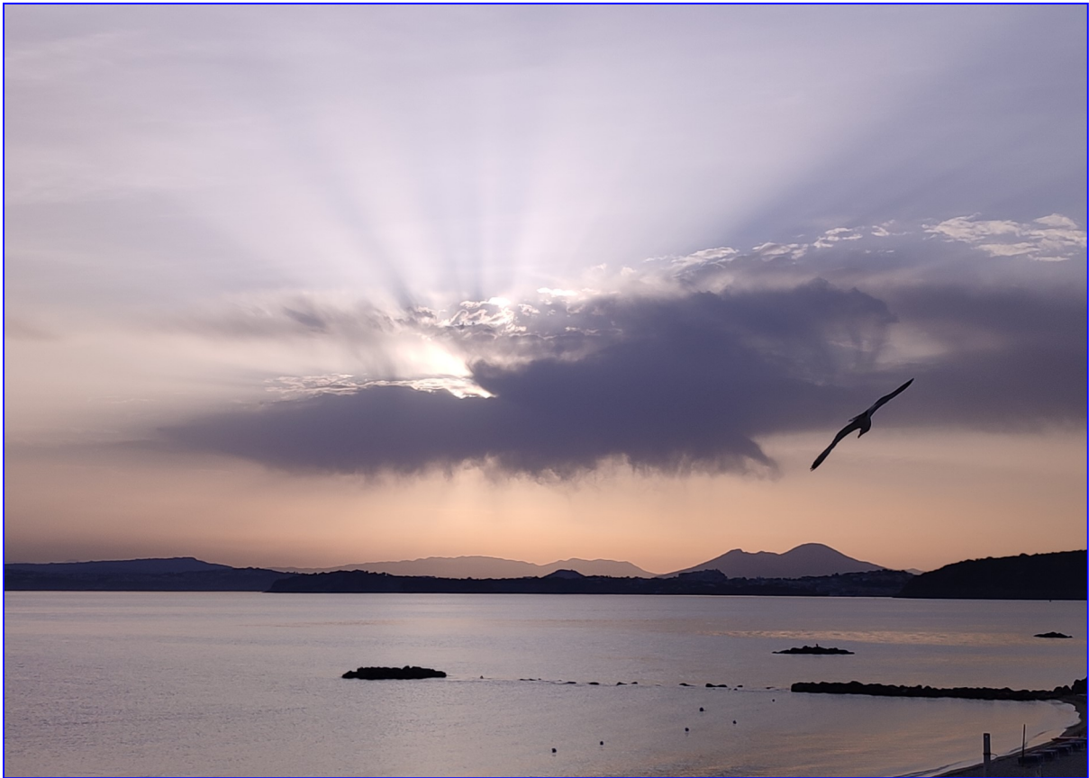
Lever de soleil sur l'île d'Ischia près de Naples